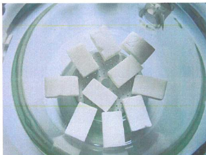
Fot.1. Wariant 1. Próbki po 4 tygodniowej inkubacji